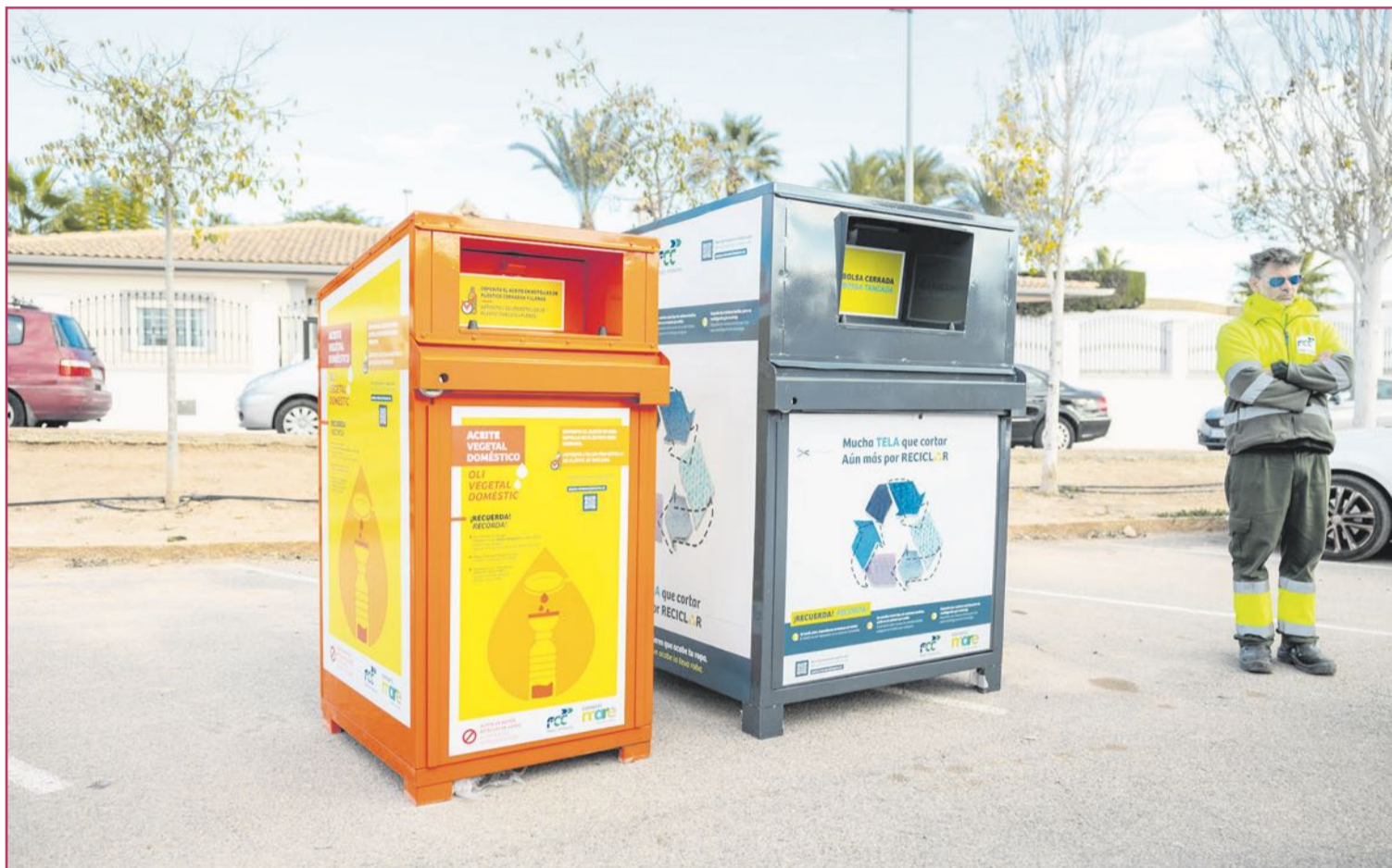
Los esfuerzos se centran ahora en el aceite y el textil.