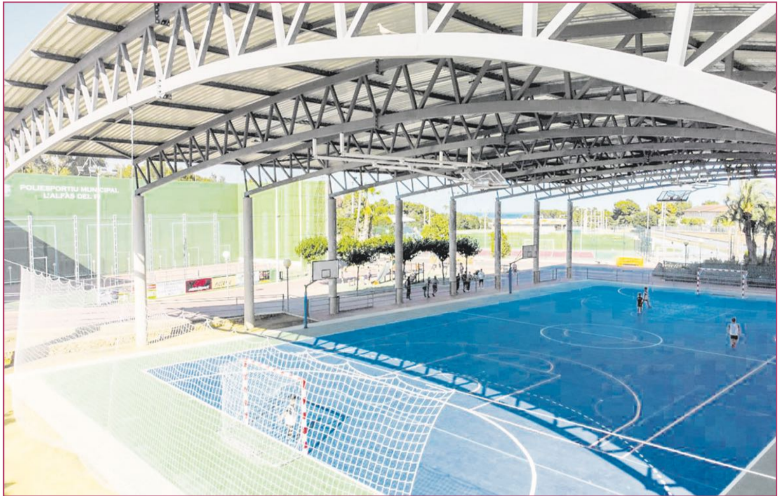
Se prevé el cerramiento de la pista multideportiva.

En concreto, tal y como ha explicado el propio Arques, el proyecto con el que l'Alfàs del Pi se presenta a esta renovada convocatoria de fondos europeos, asciende a 14.172.664,65 euros y contempla actuaciones "de vital importancia" como el cerramiento de la pista multi-