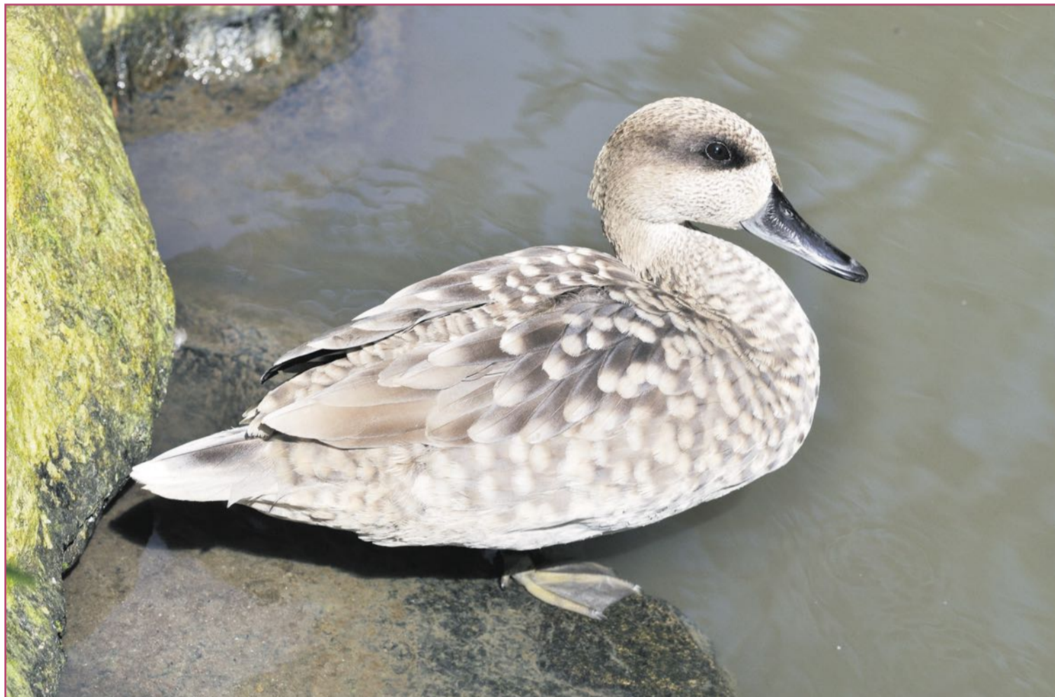
La cerceta pardilla, por desgracia, ya no visita tanto nuestros muchos humedales | Quartl

Extinciones localizadas se han dado muchas, algunas fa-