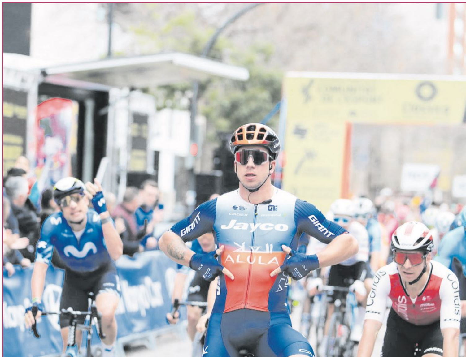
Imagen de Dylan Groenewegen, ganador el pasado año.

Dylan Groenewegen, ganador de seis etapas en el Tour, fue el vencedor en 2024